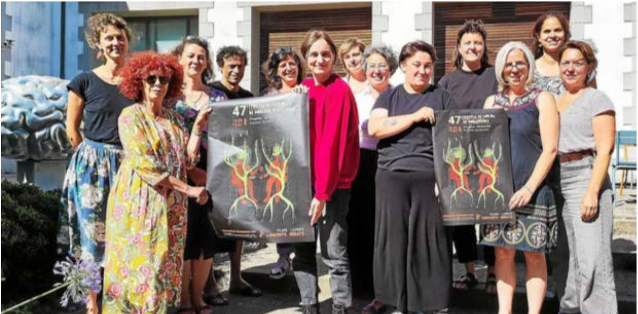
La cinéaste et activiste afro-indigène brésilienne Renaya Dorea a réalisé le visuel de l'affiche de la 47e édition du Festival de cinéma de Douarnenez. (Lannig Stervinou)

Pour sa 47e édition, qui se tiendra 16 au 23 août 2025, le Festival de cinéma de Douarnenez mettra l'accent sur les peuples d'Amazonie avec l'ambition de « montrer la réalité d'aujourd'hui ».