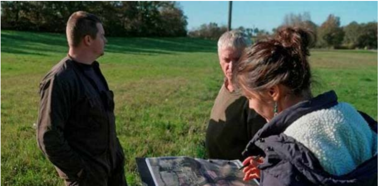
Le documentaire « Le village qui voulait replanter les arbres », de Brigitte Chevet, a été tourné à Martigné-Ferchaud (Ille-et-Vilaine).

En cette fin d'année 2025, l'association, basée à Lesmel, à Plogonnec, près de Quimper (Finistère), propose spectacles, concerts, balade botanique, art floral. Samedi 8 novembre 2025, le film « Le village qui voulait replanter des arbres » sera projeté dans le cadre de Mois du doc de Daoulagad Breizh.