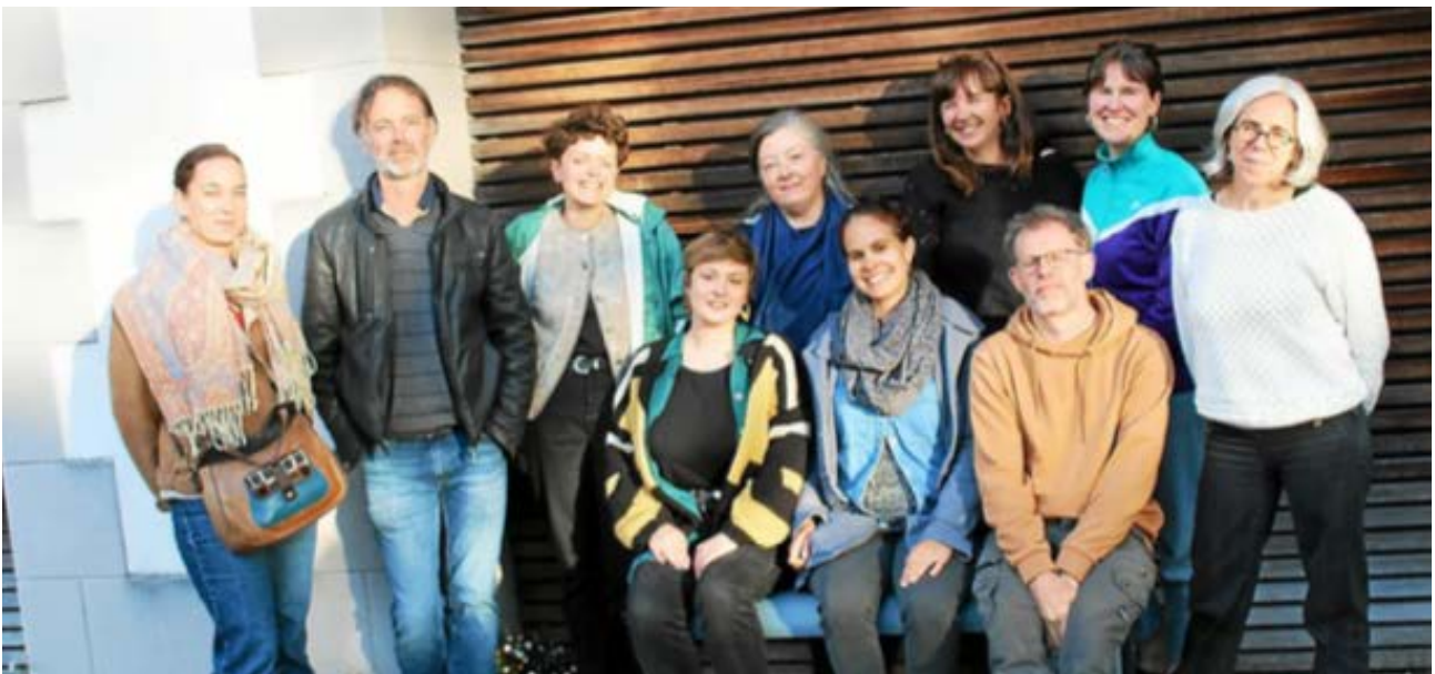
Les membres du conseil d'administration et les salariés de l'association douarneniste Daoulagad Breizh qui fait du cinéma un vecteur de lien social, de transmission culturelle, d'échange et de création.

Pour l'association douarneniste Daoulagad Breizh, qui œuvre à la diffusion du cinéma de Bretagne, l'année écoulée a été marquée par un nouveau pas vers la stabilisation après une période de fragilité économique et salariale.