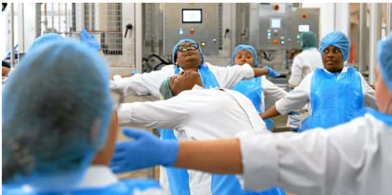
Les ouvrières de l'usine sardines de la conserverie Chancerelle en plein éveil musculaire. (Liza Le Tonquer)

Daoulagad Breizh organise une rencontre autour du documentaire « Demain au boulot », réalisé par Liza Le Tonquer, samedi 22 février à l'auditorium du Port-Musée. L'occasion de découvrir les secrets de fabrication de ce passionnant film sur le travail dans les conserveries.