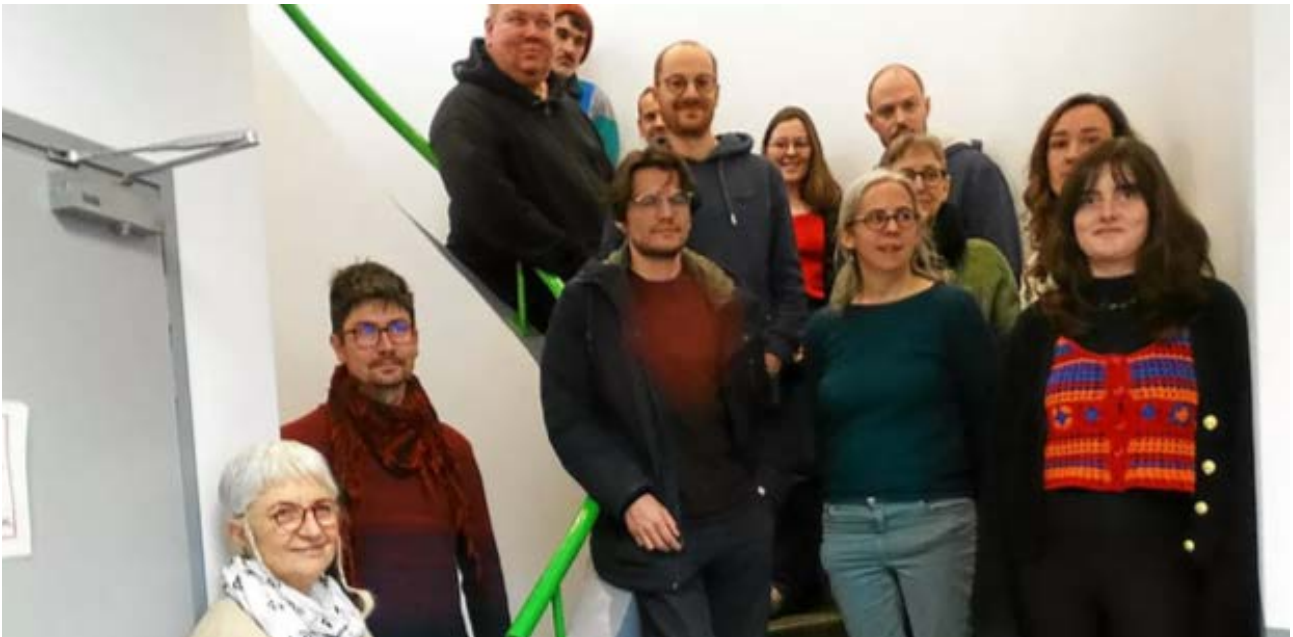
Daoulagad Breizh et Raok investis dans une démarche cinématographique, éducative et linguistique

Pilotée par Daoulagad Breizh, la 22e tournée de films d'animation doublés en breton pour les élèves des filières bilingues a débuté à Brest ce 3 mars. Elle passera par le Centre-Bretagne cette semaine.