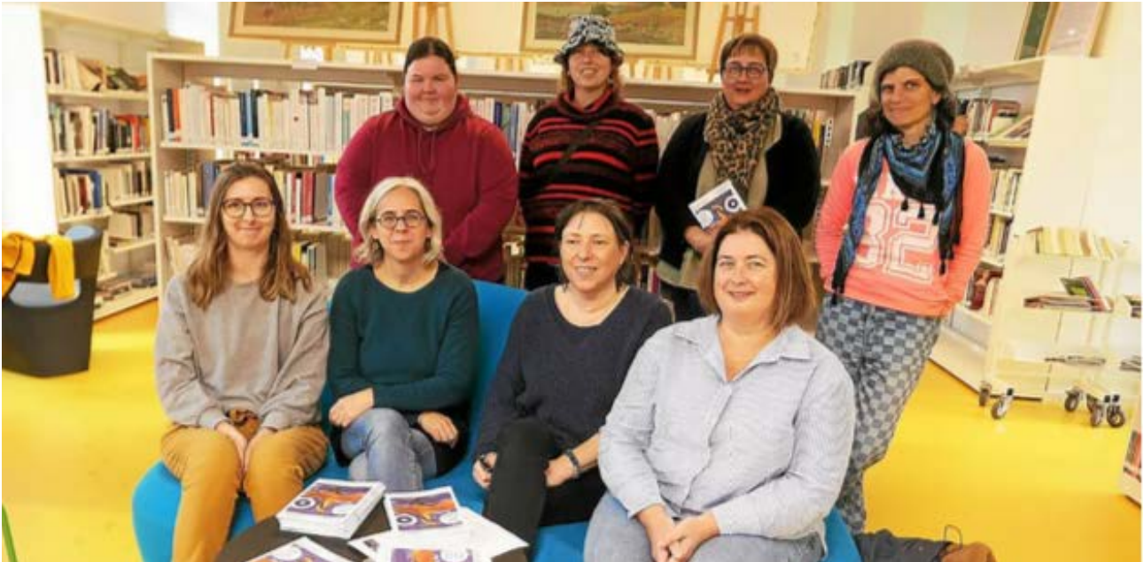
Les organisateurs et les partenaires du Mois du Doc pour le Cap-Sizun.

Dans le cadre de la 26 e édition du Mois du Doc, événement destiné à promouvoir les documentaires, plusieurs projections ouvertes au public auront lieu sur le Cap-Sizun et à l'île de Sein. La première aura lieu vendredi 14 novembre à 19 h, à Pont-Croix, avec « Naig ha me, Naig et moi ». Réservation conseillée au 07 83 88 75 57. Tarifs : normal 12€, réduit 10€.